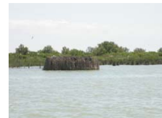
Delta del Po – laguna Basson