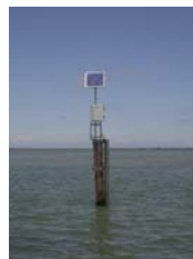
sonda di Basson