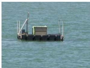
sonda di Scardovari