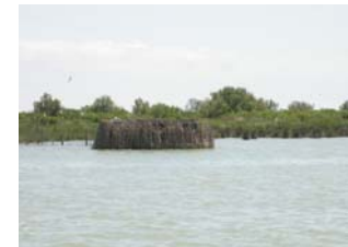
Delta del Po – laguna Basson