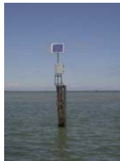
sonda di Basson