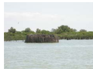
Delta del Po – laguna Basson