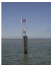
sonda di Basson