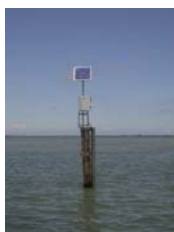
sonda di Basson