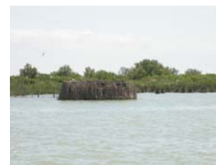
Delta del Po – laguna Basson