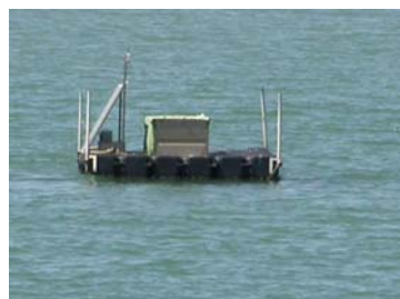
sonda di Scardovari