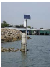
sonda di Caleri