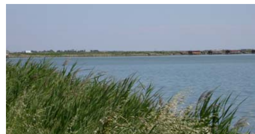
Delta del Po