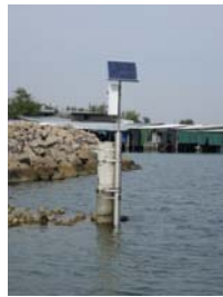
sonda di Caleri