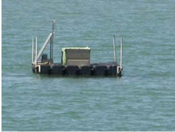
sonda di Scardovari